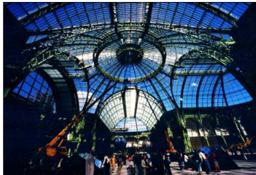
ART en CAPITAL au Grand Palais

“Les semaines de l'Art Actuel” du 9 au 19 novembre 2006