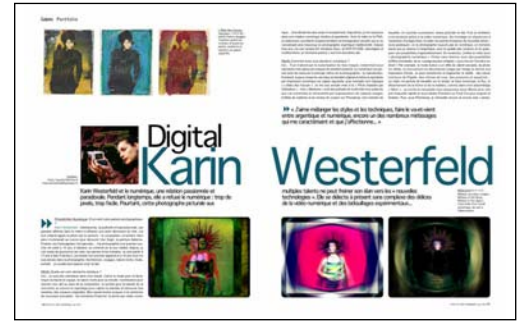
Photo & Vidéo Numérique : D'où vient votre passion photographique ?

Pendant longtemps, elle a refusé le numérique : trop de pixels, trop facile. Pourtant, cette photographe picturale aux multiples talents ne peut freiner son élan vers les “nouvelles technologies” [...].